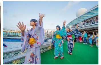
船上體驗日本傳統節日！ 舉行洋上夏季祭典！