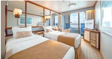
露台艙房 Balcony Cabin Size 面積：17 m 2 Including Balcony 連露台 Deck 樓層：9 (II), 10-12 (I)