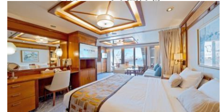
Premium Suite 豪華套房 Size 面積：48 m 2 Including Balcony 連露台 Deck 樓層：9-10