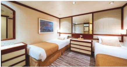
內艙房 Inside Cabin / 同行共享內艙 Semi-Single Inside (w curtain) Size 面積：13 m 2 Deck 樓層：8-11