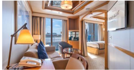
迷你套房 Junior Suite Size 面積：33 m 2 Including Balcony 連露台 Deck 樓層：10