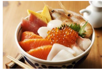
航程到訪多個日韓台城市 可品嚐多款地道美食