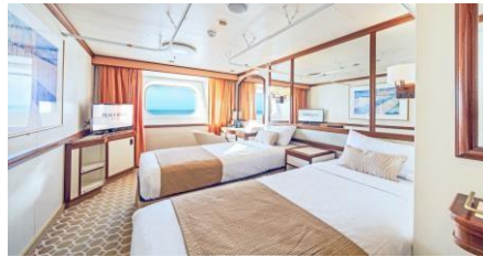
海景艙房 Outside cabin Size 面積：14 m 2 (II - Plus II) / 16 m 2 (Plus I) Deck 樓層：5-6 (II), 8 (I), 8 (Plus II), 9-11 (Plus I)